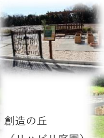
創造の丘 (リハビリ庭園)